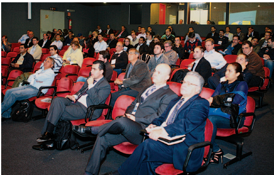
Cerca de 130 participantes acompanharam o Seminário