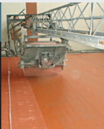
Pisos de concreto com aspersão de agregados é a nova categoria