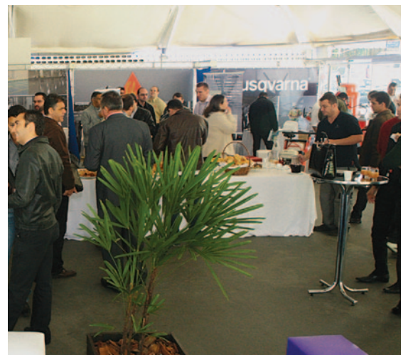
Público pode trocar experiências no intervalo para o coffee break