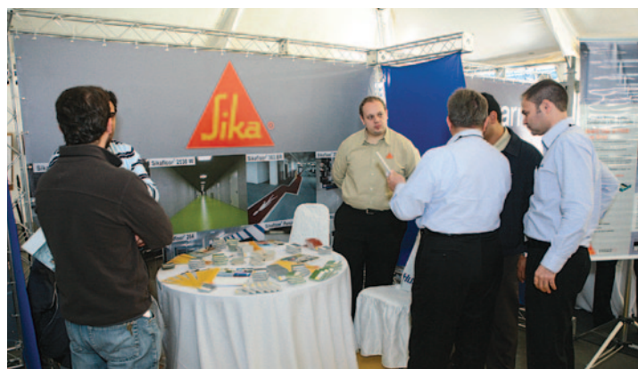
Durante o coffee break, patrocinadores puderam recepcionar os convidados e oferecer informações sobre sua linha de produtos voltados para RAD