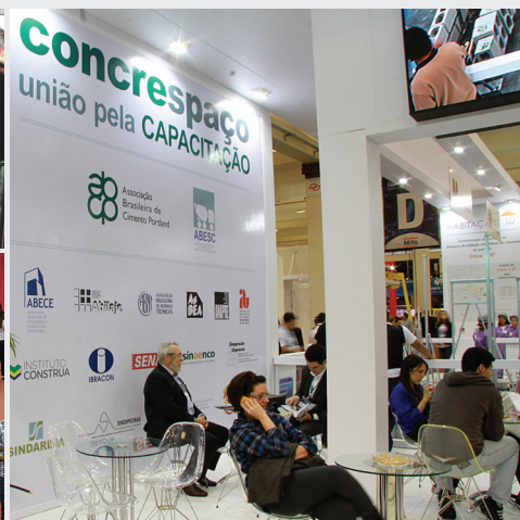
ANAPRE marcou presença no Concespaço