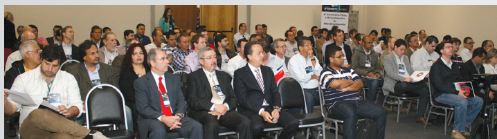
Cerca de 150 profissionais participaram do evento

O grande destaque do evento foi a entrega do IV Prêmio ANAPRE de Planicidade e Nivelamento, cujos detalhes sobre os vencedores estão nas páginas 3 e 4.